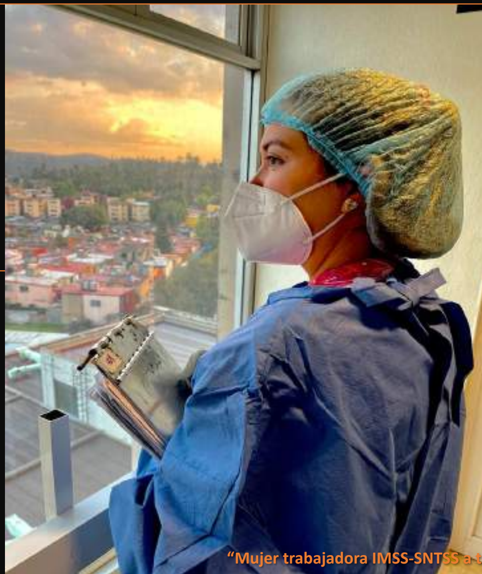
“Mujer trabajadora IMSS-SNTSS a través de la lente “