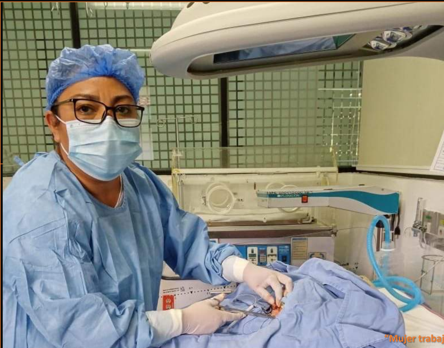
“Mujer trabajadora IMSS-SNTSS a través de la lente “