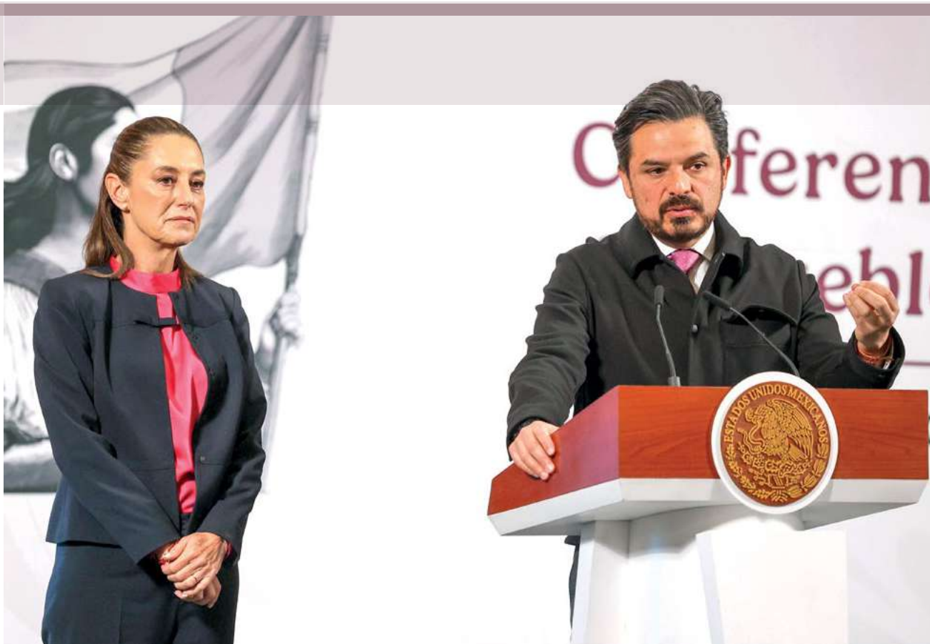
La Presidenta Claudia Sheinbaum y el Maestro Zoé Robledo, Director General del IMSS durante el anuncio de la Estrategia Nacional 2-30-100.

Agregó que desde la visión sindical, la “Estrategia Nacional 2-30-100” tiene una gran relevancia al involucrar directamente a los trabajadores referidos cuidando de manera primordial la implementación y el respeto acorde a lo establecido en el Contrato Colectivo de Trabajo.